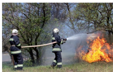
Wasser-Reservoir bei Brand Bach stauen bei abgelegenen Wald- oder Gebäudebränden