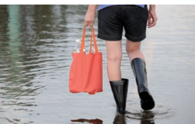
Hochwasser-Schutz Schützt Gebäude und Landschaften

Für Gemeinden, Feuerwehr, Armee, Firmen und Hausbesitzer