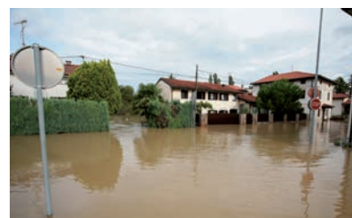
Gewässer-Beruhigung Kontrolliertes Wasserab- fließen bei Verschmutzung